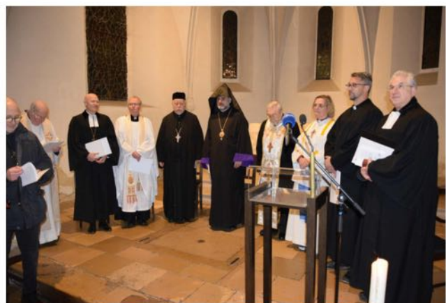
Ökumenischer Gottesdienst, Wien